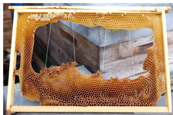
Cire de mauvaise qualité qui s'effondre