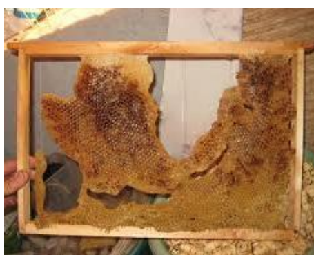
Feuille de cire non ou mal bâtie