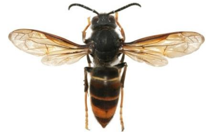
Le frelon asiatique

Une fiche d'aide à l'identification est publiée par le Museum d'Histoire Naturelle est téléchargeable sur :