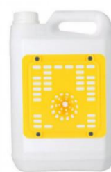
Grille jaune Neoppi