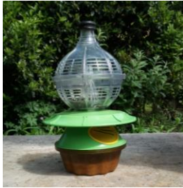
Piège dôme japonais

Seuls les pièges sélectifs sont autorisés, il s'agit de pièges nasses, équipés de cônes d'entrée avec une séparation (grille fine) entre l'appât et la partie capture pour éviter la noyade des insectes non cibles. Trou entrée \varnothing = 9\text{mm} .