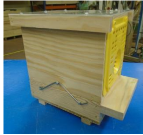
Grille jaune Neoppi