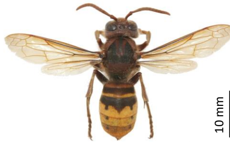
Le frelon européen