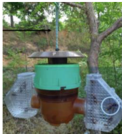
Piège coréen ou Beevital