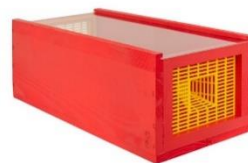
Piège Red trap