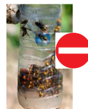
Les pièges bouteilles sont absolument interdits.