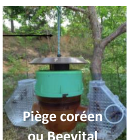
Piège coréen ou Beevital