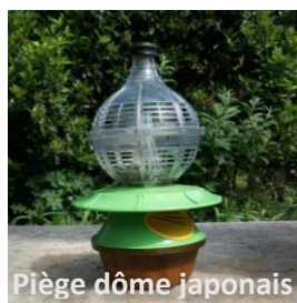
Piège dôme japonais

Seuls les pièges nasse sélectifs sont autorisés, avec une séparation (grille fine) entre l'appât et la partie capture pour éviter la noyade des insectes non cibles. Trou entrée de la nasse \varnothing = 9\text{mm} .