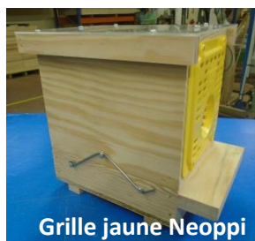
Grille jaune Neoppi