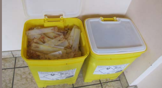
Photo 3 - Bacs de déchets DASRI pour l'élimination des lanières usagées ou périmées.