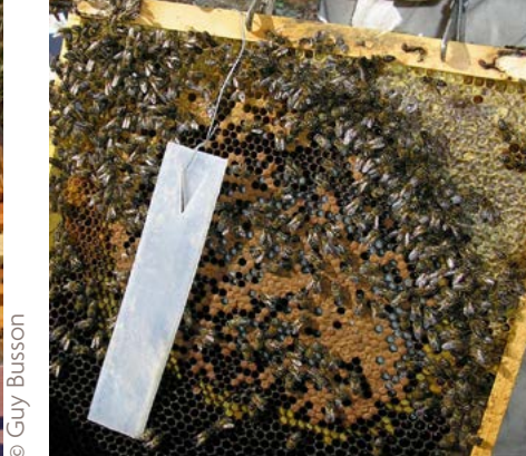
Photo 5 - Lanière d'APIVAR® centrée sur le couvain grâce à un fil de fer.